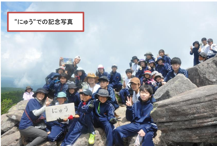
“にゅう”での記念写真

学年スローガンは「全員で協力して頂上へ～自然の大切さを感じられる二日間～」。天候にも恵まれ、自然の素晴らしさを感じることでできた二日間になりました。