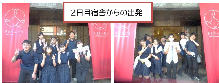
2日目宿舎からの出発