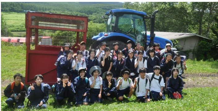
鷹山ファミリー牧場での記念写真

乳搾り体験や、魚のつかみ取り、トラクター乗車や屋外BBQなど。どの体験も楽しかったです。