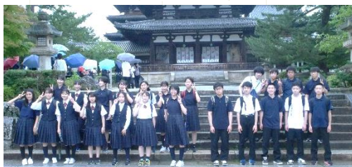
3日目クラス別見学