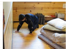
二日目の鷹山ファミリー牧場でいろいろな体験をしました