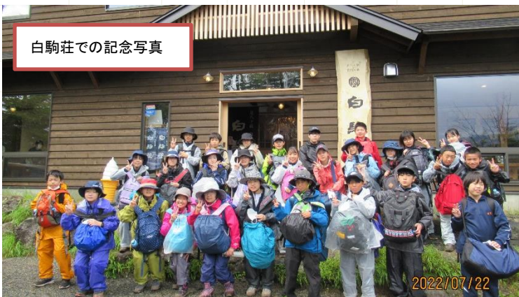
白駒荘での記念写真